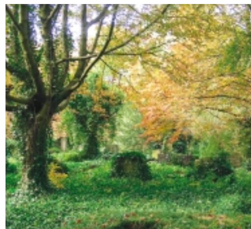
Hoewel Huis te Vraag in Amsterdam gesloten is, wordt deze begraafplaats op een dusdanige wijze onderhouden dat flora en fauna hier optimaal kunnen gedijen